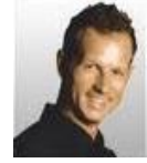
Edgar Grospron Champion olympique

L'origine, les noms, l'histoire des lieux et des migrations, les généalogies complètes de toutes les branches entre 1500 et 1750, les lignées de souscripteurs et les portraits de personnages célèbres, les alliances avec plusieurs centaines de familles, le détail des actes utilisés... Ce livre concerne les descendants et ceux qui s'intéressent aux familles de ces secteurs et à l'histoire locale. Une trentaine de pages permettent de découvrir l'histoire des notaires et des hostelleries de la vallée, un éclairage sur l'économie et quelques anciennes demeures du val de Chézery.