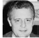
Michel Durafour Député-Maire de St-Etienne Plusieurs fois ministre Ecrivain

L'origine, les noms, l'histoire des lieux et des migrations, les généalogies complètes de toutes les branches entre 1500 et 1750 (environ 2000 « Duraffour » ou Crinquand identifiés avant 1750), les lignées de souscripteurs et les portraits de personnages célèbres, les alliances avec plusieurs centaines de familles, le détail des actes et des sources utilisées... ce livre concerne les descendants et ceux qui s'intéressent à l'histoire locale et aux familles de ces secteurs.