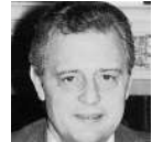
Michel Durafour Député-Maire de St-Etienne Plusieurs fois ministre Ecrivain

L'origine, les noms, l'histoire des lieux et des migrations, les généalogies complètes de toutes les branches entre 1500 et 1750 (environ 2000 « Duraffour » ou Crinquand identifiés avant 1750), les lignées de souscripteurs et les portraits de personnages célèbres, les alliances avec plusieurs centaines de familles, le détail des actes et des sources utilisées... ce livre concerne les descendants et ceux qui s'intéressent à l'histoire locale et aux familles de ces secteurs.